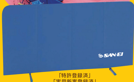
「特許登録済」 「実用新案登録済」

両サイドのファスナーをあげると約2㎡分(BF-1)、約3㎡分(BF-2)のスペースのクッションシートとなります。2~3名分の脚部防寒。その他カバーを羽織るなどすれば低体温などから身体を守ることができます。