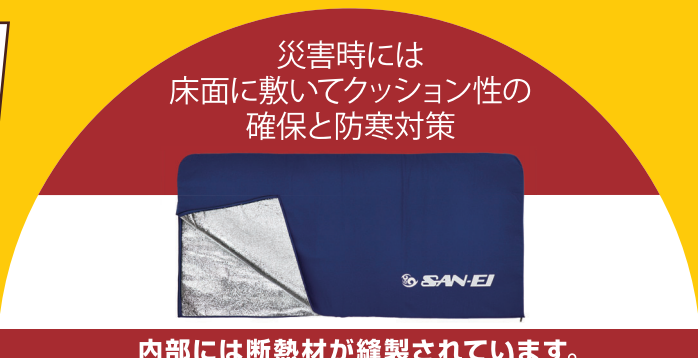
災害時には 床面に敷いてクッション性の 確保と防寒対策