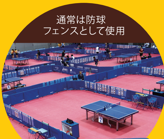
通常は防球 フェンスとして使用

災害の発生と同時に体育館・公共施設は、多くの方々の避難場所となります。場所を区切る目的としてフェンスの使用が見受けられますが、床面に直接座ることによる身体への痛み、冬期などは暖房供給停止による寒さなどへの初期対応策が必須とされています。このフェンスカバーは 通常時は卓球フェンス としてご利用いただき、 災害時にはクッション素材・防寒対策 としての役割を兼ね備えた商品です。